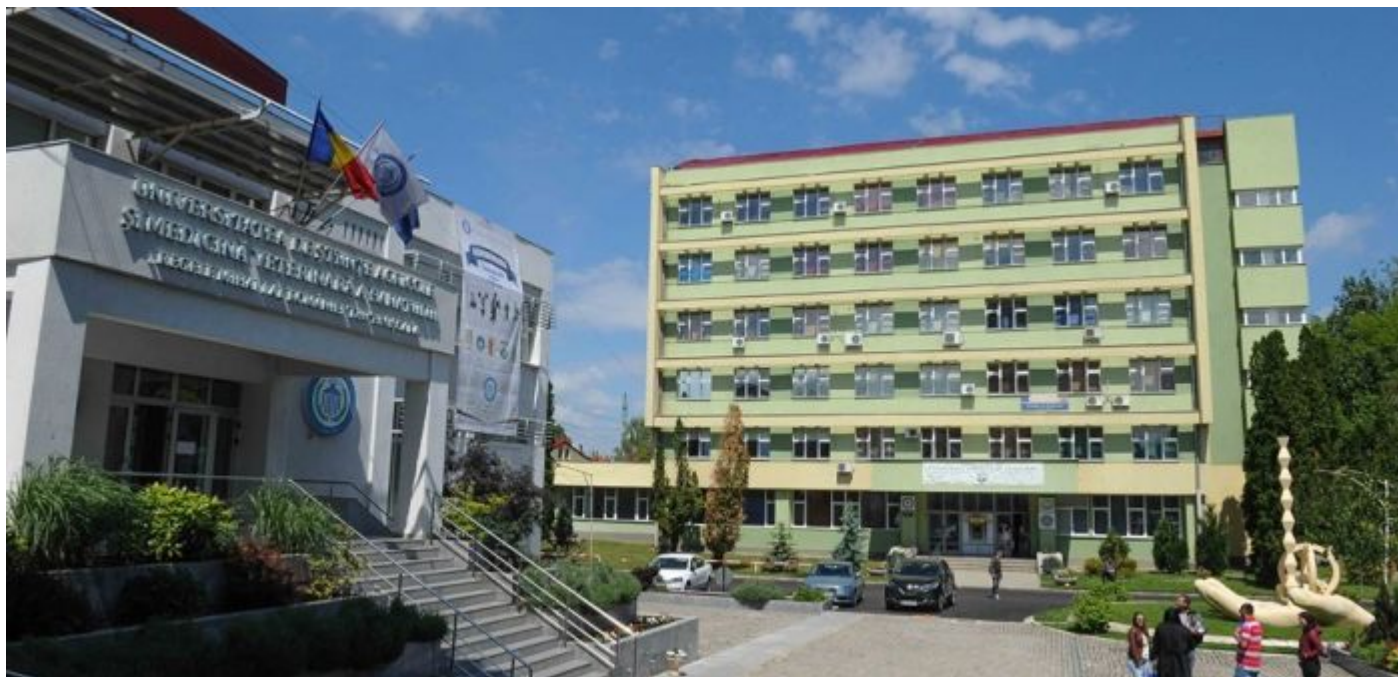
Universitatea de Științe Agricole Timisoara