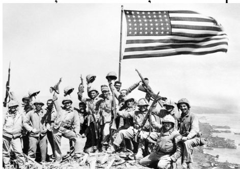
Soldati americani sarbatoresc victoria dupa batalia de pe insula japoneza

Bătălia a fost immortalizată în celebra fotografie a lui Joe Rosenthal, intitulată Înălțarea drapelului pe Iwo Jima, ce ilustrează ridicarea drapelului SUA pe Muntele Suribachi, un deal de 166 m altitudine, de către cinci pușcași marini și un marinar. Fotografia reprezintă a doua înălțare a drapelului pe munte, ce a avut loc în ziua a cincea a bătăliei care a durat 35 de zile. Ea a devenit imaginea de referință a bătăliei și a fost reprodusă frecvent.