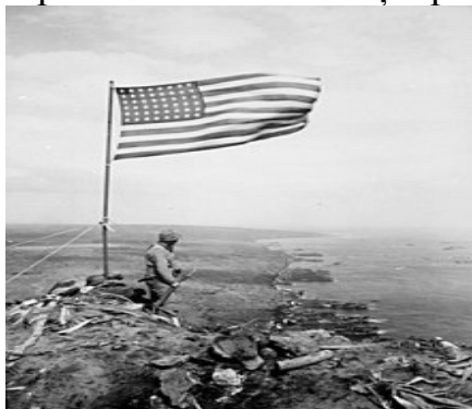
Drapelul Statelor Unite înălțat pe Muntele Suribachi în februarie 1945.

În planul pentru atacarea insulelor principale, s-a ținut cont că circa o treime din soldații angajați în luptele de la Iwo Jima și apoi la Okinawa muriseră