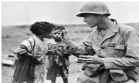
Un soldat american isi imparte portia de mancare cu doi copii japonezi